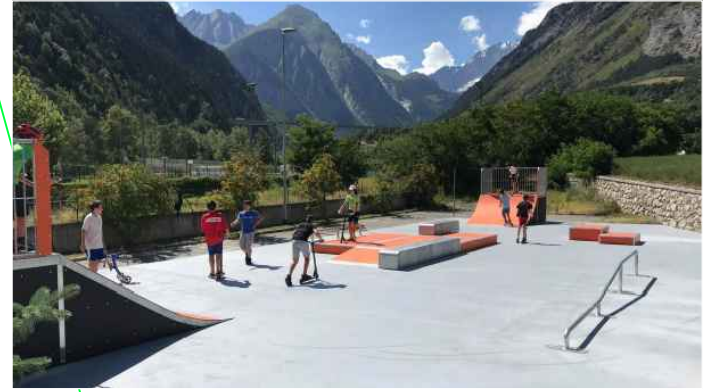
gördeszkalelemek betonfelületen elhelyezve